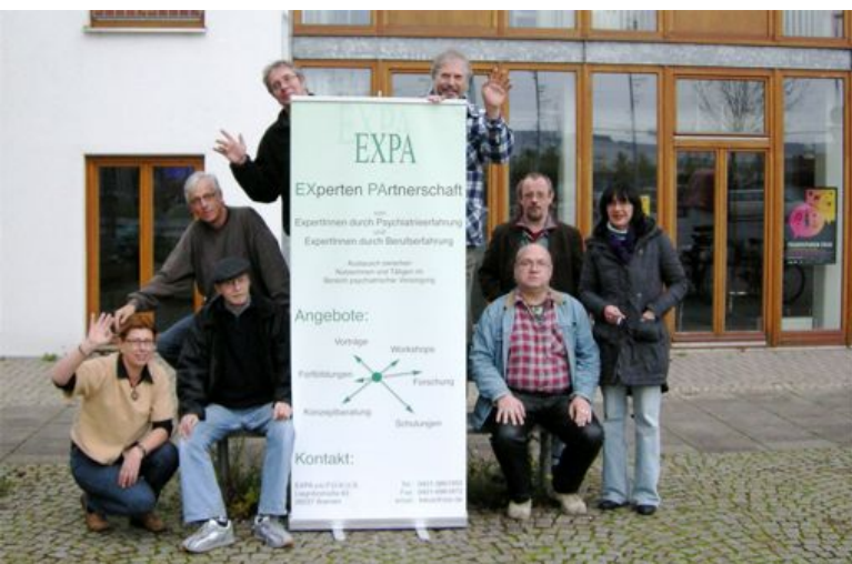
Aktive im EXPA-Netzwerk

Die Initiative zur sozialen Rehabilitation ist ein gemeinnütziger Verein, der 1982 im Zusammenhang mit der Auflösung der psychiatrischen Langzeitklinik „Kloster Blankenburg“ entstanden ist. Heute betreut die Initiative Menschen mit psychischer Erkrankung, Suchterkrankung oder geistiger Behinderung in verschiedenen Wohnformen, mit verschiedenen Freizeit- und Beschäftigungsangeboten. Um die Arbeit mit psychisch kranken Menschen kontinuierlich zu verbessern, hat die Initiative einen eigenen Fortbildungsträger – Fokus – gegründet.