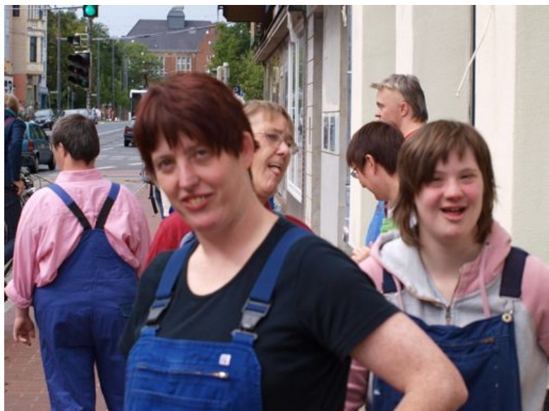
Bei der Eröffnung der neuen Räume des Martinsclubs Bremen: Die Theatergruppe vor ihrem Auftritt

Der PARITÄTISCHE ist einer der sechs Spitzenverbände der Freien Wohlfahrtspflege. Der Paritätische Gesamtverband umfasst 15 Landesverbände. Bundesweit gehören etwa 10.000 Organisationen mit rund 500.000 Beschäftigten zum PARITÄTISCHEN.