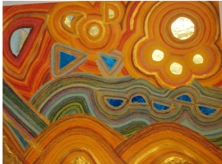
Heidrun Schwandt: Hundertwasser Aus der Arbeit der Tagesstätte Süd der Bremer Werkgemeinschaft

Zur Unterstützung gehört, dass die individuellen Kompetenzen der beeinträchtigten Menschen gefördert und sie an der Planung der Hilfen beteiligt werden. Die unterschiedlichen Interessen und Lebenssituationen von Männern und Frauen werden berücksichtigt.