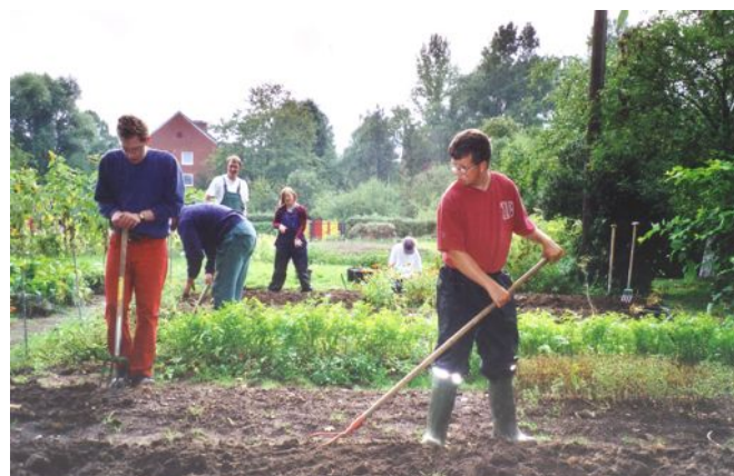
Arbeit auf der Parzelle für Verkauf und Eigenbedarf

Das Zusammenleben spielt eine große Rolle. „Wir möchten nicht, dass die jungen Leute in ihrer Freizeit nur vor dem Fernsehen sitzen“, sagt Oetting. Nach Arbeitsschluss trifft man sich in den Wohngruppen, trinkt Kaffee und redet über den Tag. Kreative und künstlerische Angebote, Spiele oder Sport stehen dann auf dem Programm.