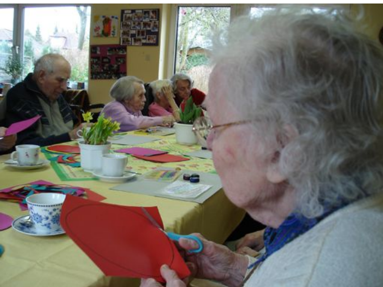
Tagesbetreuung in einer gerontopsychiatrischen Fördergruppe