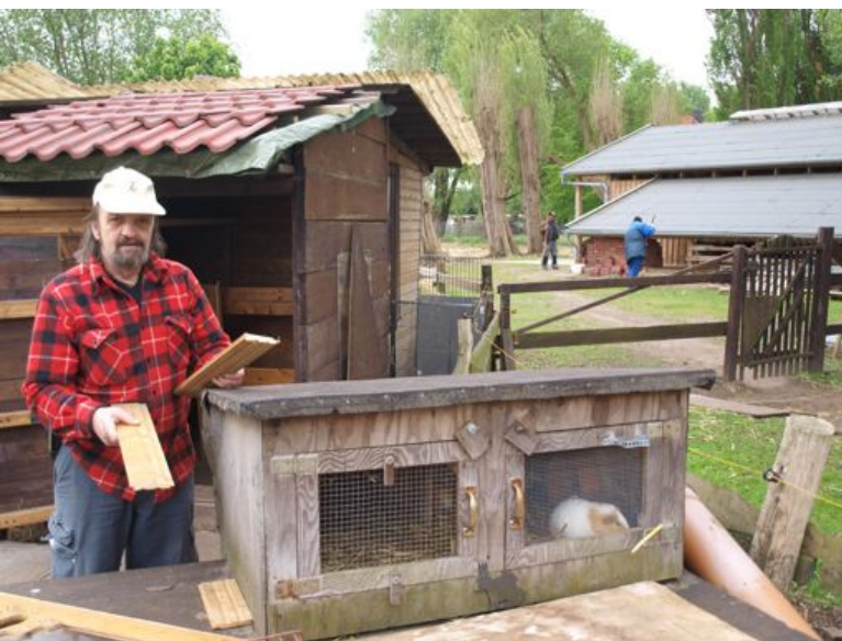
Tiere versorgen, Ställe und Gelände in Ordnung halten: Der Streichelzoo bietet sinnvolle Arbeitsgelegenheiten für In-Jobber.

Zum Wilden Westen gehört noch ein Spielhaus und eine Suppenküche, in denen ebenfalls In-Jobber beschäftigt sind. Im Kinderhaus werden Kinder bis zehn Jahre betreut, es gibt Hausaufgabenhilfe und Elternkreise. Nebenan in der Suppenküche erhalten die Kinder der nahegelegenen Grundschule ein kostenloses Frühstück und Menschen mit geringem Einkommen können hier sehr preiswert Mittagessen.